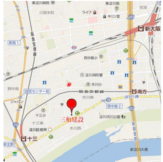
阪急十三駅または地下鉄西中島南方下車、淀川通りを徒歩で約10分 大阪市営バス停 木川西二丁目前

下記申込書にご記入の上、FAX またはinfo@workshop-haccp.org に必要事項を記入して送付下さい